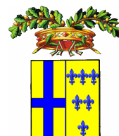
Provincia di Parma