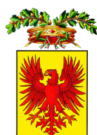
Provincia di Ravenna